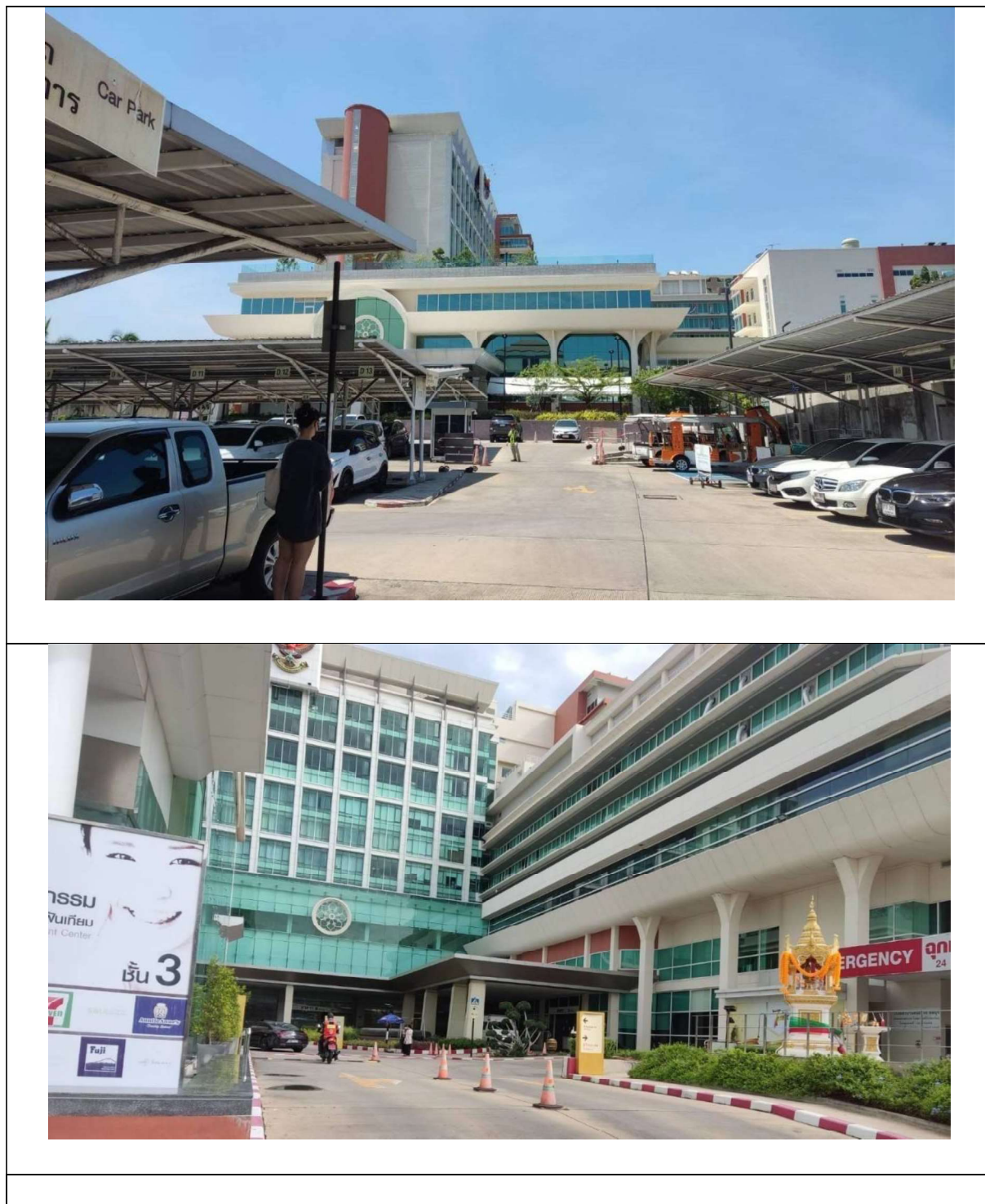
รูปที่ 1-2 ภาพพื้นที่โครงการสมิติเวช ชลบุรี

ปัจจุบันโครงการโรงพยาบาลสมิติเวช ชลบุรี เปิดให้บริการโรงพยาบาลขนาด 260 เตียง ภาพพื้นที่โครงการปัจจุบันแสดงดังรูปที่ 1-2